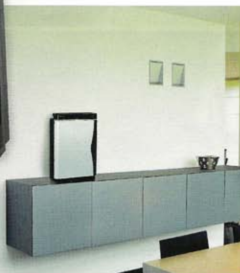
Purificateur de l'air, modèle MC707