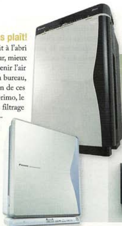
Purificateur et humidificateur de l'air, modèle MCK75JVM-K